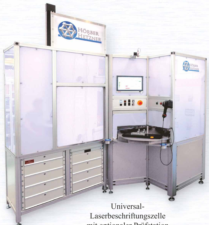
Universal-Laserbeschriftungszelle mit optionaler Prüfstation

Getreu unserem Slogan „Die Ideenfabrik für Maschinenbau - Konstruktion“ unterstützen wir Sie dabei, Ihr Vorhaben in die Realität umzusetzen.