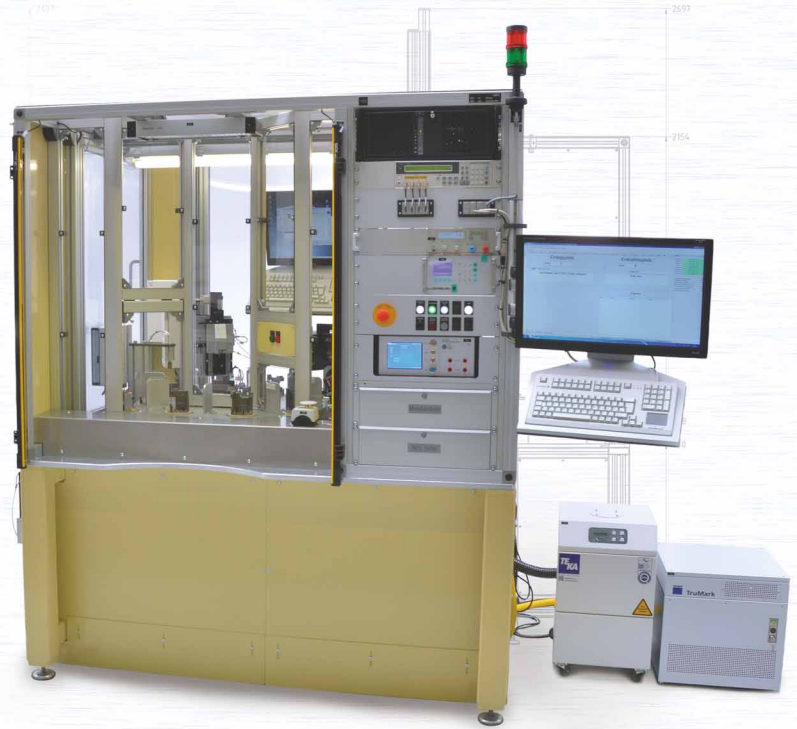
EOL-Programmier-, Prüf- und Beschriftungsplatz