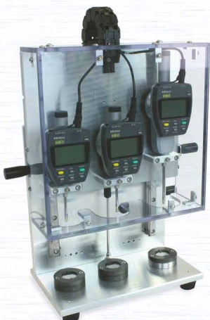
Qualitäts-Messeinrichtung für Elektronik-Komponenten

Generalunternehmerschaft Konzepterstellung Projektierung CAD-Konstruktion Zeichnungserstellung Einkauf & Materialbeschaffung Montage & Inbetriebnahme Qualitätssicherung Dokumentation Änderungsdienst Pneumatik- & Funktionspläne Ersatzteilbeschaffung