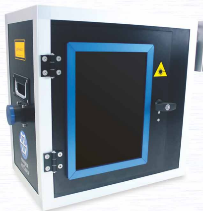
Schutzbox für mobile Beschriftungslaser